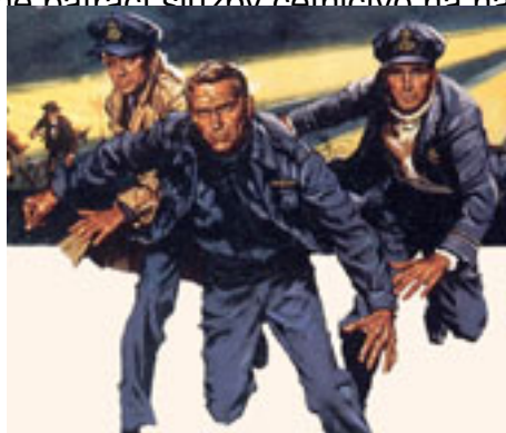
Muži Třetí říše

Četnické případy - k zvaně pátrací služby četnictvo na našem území stále více používalo kromě kriminalis