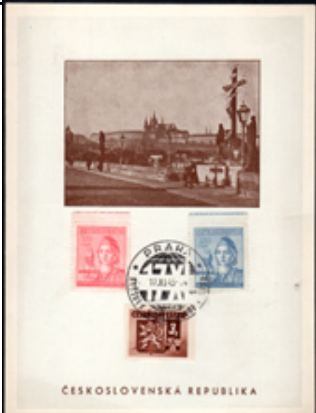
Každá karta má číslo 17. Hlavním autorem je Vápenka.