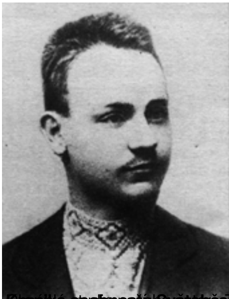
Kronika událostí: Světově známý vědec, letce, diplomat a generál M. B. Štefánik.