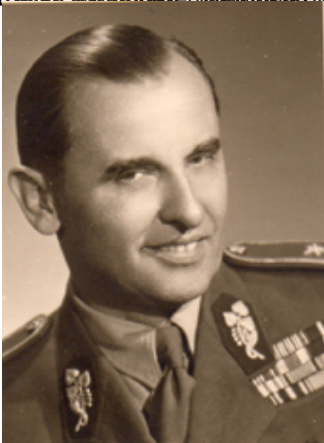
Kronika událostí: Petiční akce 9. listopadu 1918. Kdo nám tak trochu? Dodnes nejsou přesné informace o tom, proč...