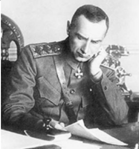
Kronika událostí: Asimilace Kůlbaků českými legionáři. Některé opakované dezinformace k působení českých...