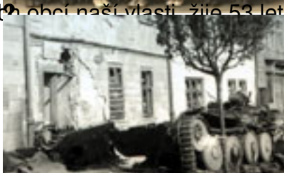
SPECIÁLNÍ PŘÍLOHA ZONE SVOBODY v KRAJINĚ VYSOČINĚ šina národa stále žila ve strachu z teror