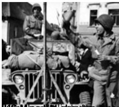
SEMISEVĚŘIČKY americké armády 8. května 1945 v zapadlém koutu severovýchodních Čech, v Lázních