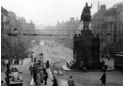
Květnové povstání bylo VELÉMETNĚ BOHUČIČI osvobození. Vedle vojenského významu mělo morální